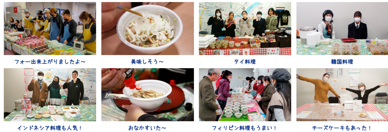
フォー出来上がりしましたよ～