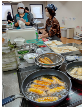
調理室からいい匂い！

今年はベトナム、フィリピン、インドネシア、タイ、韓国、日本から、フォー、ネムザン、テロンなど珍しい料理を楽しむことができました。調理を担当してくれた外国人&ボランティアの皆様は、生涯学習センターの調理室で朝早くから準備してくださいました。「この料理をいつも楽しみに来ている」「本場のスパイスなどを使っていて、北上では普段食べられない料理が多いのでうれしい」など、来場者の中でも料理を楽しみにしてくれている人が多く、会場はどここの国かと思うほど大勢の外国人でブースがにぎわっていました。