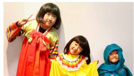
かわいい民族衣装のモデル三人

QUIZ 2 : How many toes does a dragon have in most Japanese art? 日本の場合、龍の足の指は何本あるのでしょうか？