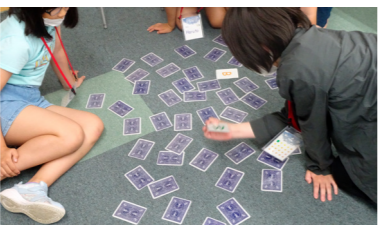
マッチングゲーム