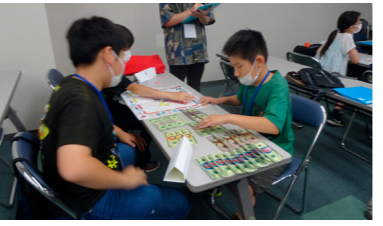
お金持ちになるぞ!

QUIZ 2 : What is both a letter of the alphabet and a drink? 「アルファベットの中で、飲み物の名前でもある文字はなんですか?」 (答えは4ページの下)