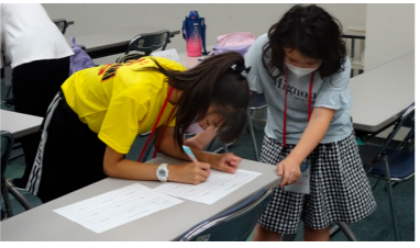
一所懸命書いています