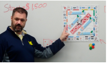
ケビン先生のスペシャルモノポリー