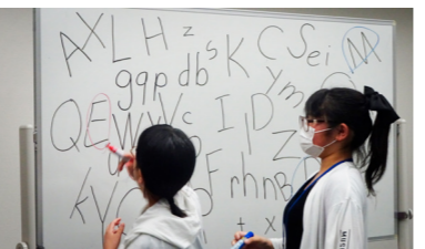
アルファベットハンター