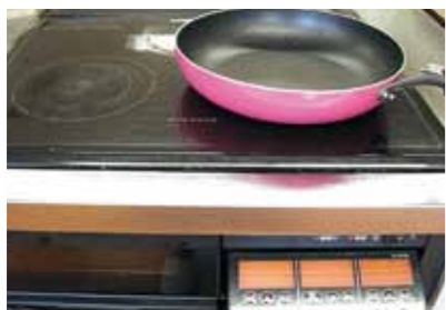
hi wo kesu ひ を けす