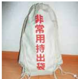
hijoyo mochidashi bukuro ひじょうよう もちだし ぶくろ