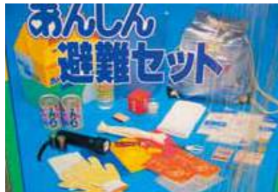
hinan setto ひなんセット (せっと)