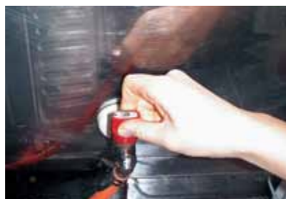
gasu no motosen wo shimeru ガスの もとせん を しめる