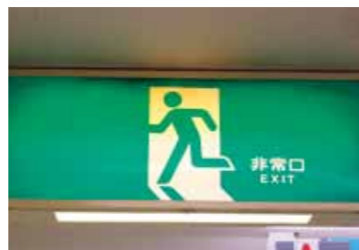
hijo guchi ひじょうぐち