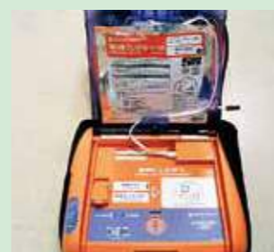
AED エイ・イー・ディー

AED (Automated External Defibrillator) 自動体外式除細動器