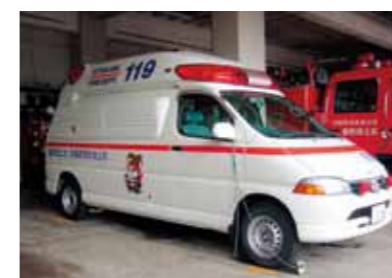
kyukyusha きゅうきゅうしゃ