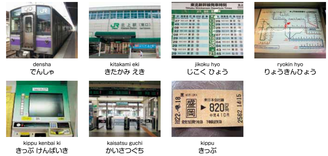
densha でんしゃ kitakami eki きたかみ えき jikoku hyo じこくひょう ryokin hyo りょうきんひょう kippu kenbai ki きっぷ けんばいき kaisatsu guchi かいさつぐち kippu きっぷ