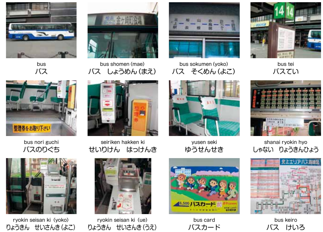
bus バス bus shomen (mae) バス しょうめん(まえ) bus sokumen (yoko) バス そくめん(よこ) bus tei バステい bus nori guchi バスのりぐち seiriken hakken ki せいりけん はっけんき yusen seki ゆうせんせき shanai ryokin hyo しゃない りょうきんひょう ryokin seisan ki (yoko) りょうきん せいさんき(よこ) ryokin seisan ki (ue) りょうきん せいさんき(うえ) bus card バスカード bus keiro バス けいろ